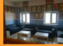
Soru çözme köşesi